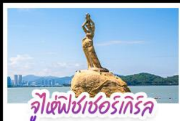
จุ๊เซฟิซเซอร์ทึกรึค