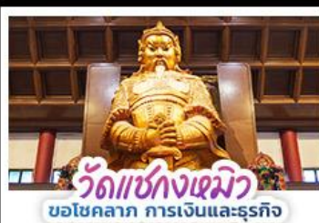
วัดแห่งกวมิว ขอโชคลาภ การเงินและธุรกิจ