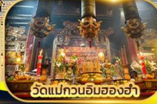
วัดแม่กวนอิมฮ่องฮ่า