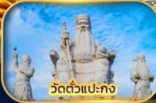
วัดตัวแปะกง