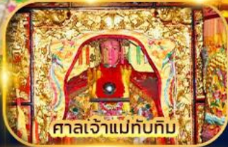
ศาลเจ้าแม่ทับทิม