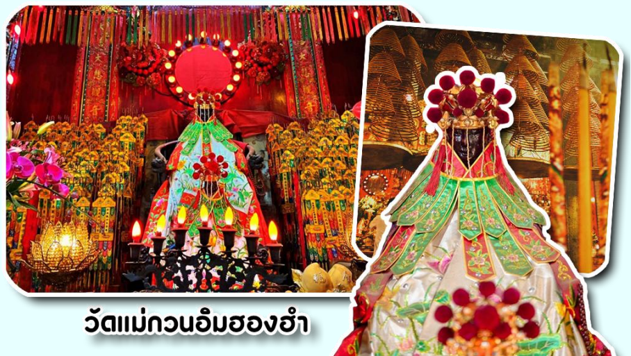
วัดแม่กวณิมสองฮำ

จากนั้นพาท่านเดินทางสู่ เมืองฮ่องกง พาท่านไปไหว้ขอพรองค์เจ้าแม่กวณิม ณ วัดแม่กวณิมสองฮำ วัดเก่าแก่ของฮ่องกงสร้างตั้งแต่ปี ค.ศ.1873 เป็นวัดขนาดเล็กที่มีชาวฮ่องกงศรัทธานับถือกันเป็นอย่างมากวัดแห่งนี้เป็นสถานที่ประดิษฐาน องค์เจ้าแม่กวณิมสองฮำ ที่มีชื่อเสียงเรื่องการให้ยืมเงินเชื่อกันว่าท่านช่วยพลิกฟื้นเศรษฐกิจของชาวฮ่องกง ผู้คนจึงนิยมมายืมเงินทำธุรกิจจนสำเร็จรำรวย รุ่งเรืองโดยให้ท่านอธิษฐานขอพรต่อหน้าเจ้าแม่กวณิมสองฮำพร้อมกับระบุวันเวลาในการขอพรด้วย จากนั้นนำธูปบัตร์ตามฐานะและศรัทธาที่เราจะนำเป็นสื่อในการขอพร เขียนจำนวนเงินที่ต้องการลงไปด้วย ใสสกุลเงินย้งดีใหญ่ แล้วนำเงินใส่ในซองแดง ควรเตรียมซองแดงไปเอง นำซองแดงไปวนรอบกระถางรูป วนขวาจำนวน 3 ครั้ง แล้วเก็บซองแดงในกระเป๋าสตางค์เป็นเงินขวัญถุง ถ้าประสบความสำเร็จตามที่มุ่งหวังให้นำเงินในซองแดงทำบุญหยอดตู้ที่วัดแห่งนี้ในโอกาสต่อไป