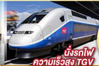
นั่งรถไฟ ความเร็วสูง TGV