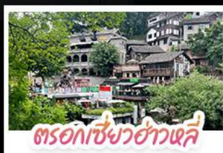
ตรอกเซี่ยวฮ่าวเฉี