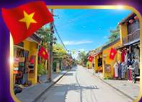
เมืองเก่ามรดกโลก ฮอยอัน