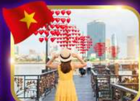
เชคอินสะพานแห่งความรัก