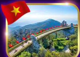
สะพานมือสีทอง บานาฮิลล์