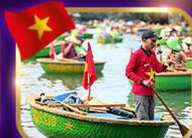
เรือกระด้ง หมู่บ้านก๊อบกาน