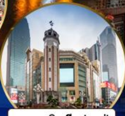
ถนนคนเดินเจียงฟางเป่ย์