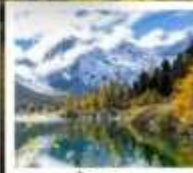
ปี้เพ็งโกว