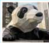
ห้าง IFS แพนด้าปิ่นตึก