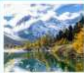
ปี้ผิงโกว