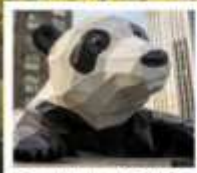
ห้าง IFS แพนด้าปิ่นตึก