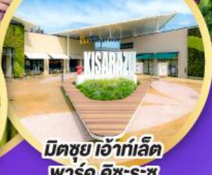
มิตซูเอะอิเกะ พาร์ค คิซะระซุ