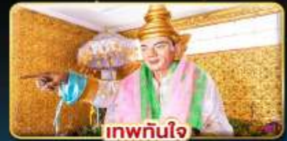
เทพกษัตรี