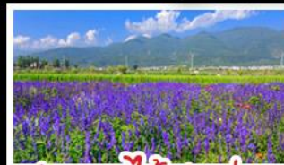
สวนดอกไม้ฮาวามู่ฉาง