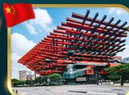
แลนด์มาร์กจิ้ง ตึกตะเกียบ