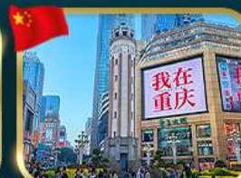
ถนนคนเดินเจียงฟางเป่ย์