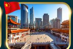
เขื่อนตึกควังซิงโหล