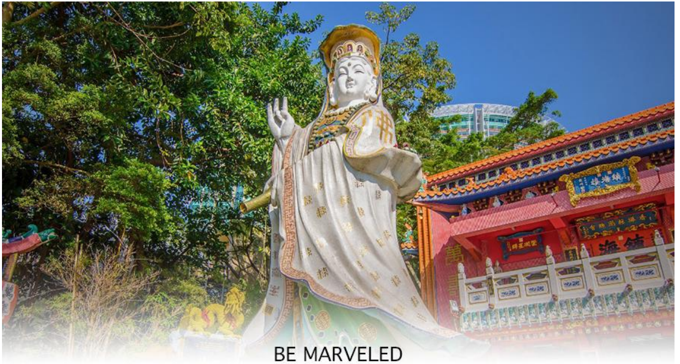
BE MARVELED วัดเจ้าแม่กวนอิมริพลัสเบย์

จากนั้นนำท่านเดินทางสู่ วัดหลินฟ้า (LIN FA KUNG TEMPLE) วัดหลินฟ้ากงอยู่ในย่านหว่านไฉ่ ตั้งอยู่บนเนินเขาหันหน้าออกสู่ทะเลทางทิศตะวันออกเฉียงใต้ของอ่าวคอสเวย์ ถึงแม้จะเป็นวัดเล็ก ๆ แต่วัดหลินฟ้า คือวัดเก่าแก่ที่มีประวัติความเป็นมาเกี่ยวข้องกับความศักดิ์สิทธิ์ของเจ้าแม่กวนอิมโดยตรงวัดนี้ตั้งอยู่บนถนนลิลี สตรีท (Lily St.) ที่เชื่อมต่อกับถนน Lin Fa Kung ตามชื่อวัดหลินฟ้า ตำนานเล่าว่า ในสมัยราชวงศ์ซิง เจ้าแม่กวนอิม หรือพระโพธิสัตว์กวนอิม ซึ่งเป็นเทพีแห่งความเมตตา ได้ปรากฏกายขึ้นบนโขดหินรูปดอกบัว (Lotus Rock) ณ บริเวณที่ตั้งของวัดในปัจจุบัน ชาวบ้านเชื่อว่าการปรากฏกายของเจ้าแม่กวนอิมเป็นสัญลักษณ์ของความโชคดีและการคุ้มครองจากภัยพิบัติต่างๆ จากจุดนี้ เราสามารถเดินเล่นเดินเที่ยวต่อไปยังถนนเส้นอื่น ๆ ได้ง่าย ตลอดเส้นทาง ทำให้วัดหลินฟ้า หรือ หลินฟ้ากง (Lin Fa Kung) แห่งนี้ อยู่ในจุดที่นักท่องเที่ยวสามารถเข้ามาไหว้ขอพรเจ้าแม่กวนอิมวังดอกบัวได้สะดวก