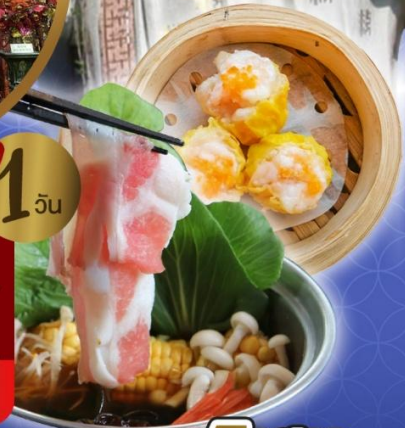
เจ้าแม่กวนอิม ริพลีสเบย์