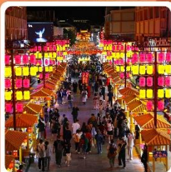
ตลาดกลางคีนซาโจว