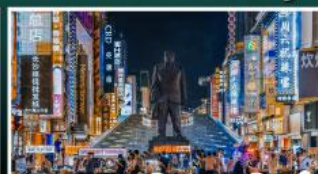
ถนนแดนเดินเขาวงกต