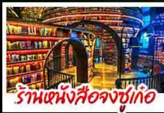
ร้านหนังสือจุงชู่เกอ