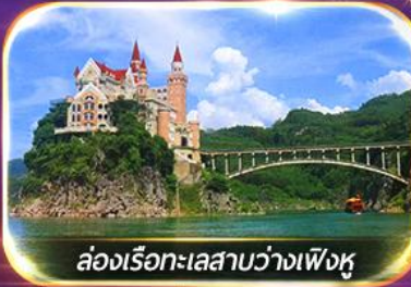
ล่องเรือทะเลสาบว่างเฟิงหู