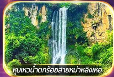
หุบเขาน้ำตกร้อยสายหม่าหลิงเหอ

ชมวิถีชีวิตหมู่บ้านปู้อี้ยามค่ำคืน, ล่องเรือทะเลสาบว่างเฟิงหู ชมสวนดอกไม้ตามฤดูกาล, ซุปบึงจู่ใจถนนคนเดิน