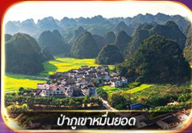
ป่าภูเขาหมื่นยอด