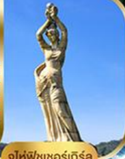
จูไห่ฟิชชอร์ทิวรา