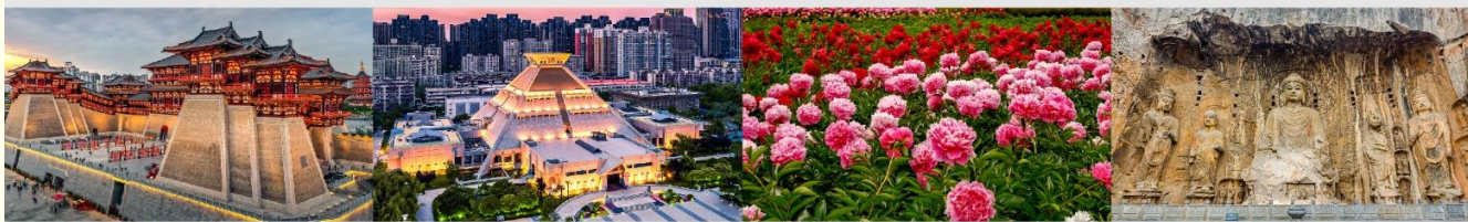
พิพิธภัณฑ์มณฑลเหอหนาน