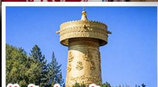
วัดต้าฝอ กงล้อมณฑล