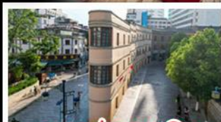
ถนนเก่าคุณหมิง