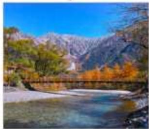
ดามิโดจิ