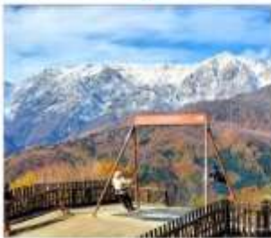
ฮาคูเนะอิวาทาเกะ