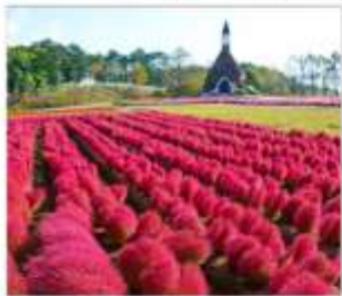
สวนดอกไม้มัมกคะโนะซาโตะ