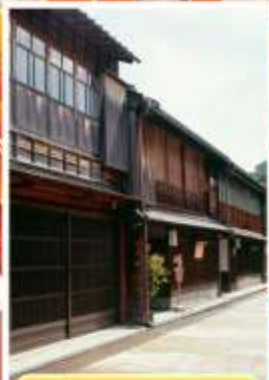
ย่านอิงาชิซายะ