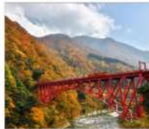
รถไฟชมวิวยุเมเวาคูโรเมะ