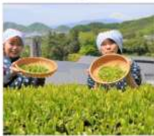
กิจกรรมเก็บชา