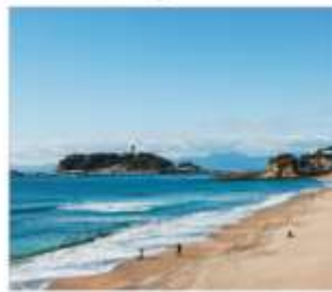
เกาะเอโนชิมะ