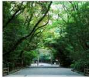
ศาลเจ้าอัสึตะ