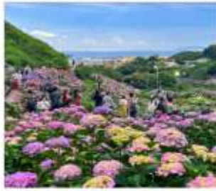
เทศกาลดอกไฮเดรนเยีย