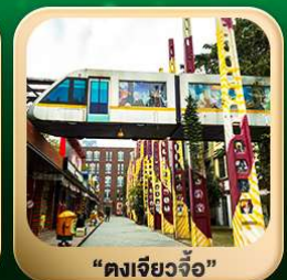
“ตงเจียวจื่อ”