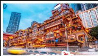
เจียงหยาดัง

อุทยานหลุมบ่อฟ้า - อุทยานเขานางฟ้า หงหยาดัง - นั่งรถไฟทะเลสาบ - อุทยานสี่ดรุณี ปี่ผิงโกว - สะพานหนานเฉียว