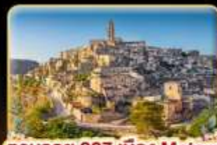
ตามรอย 007 เมือง Matera