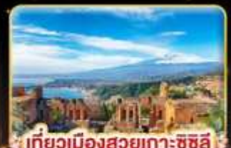
เที่ยวเมืองสวยเกาะซิซิลี Taormina