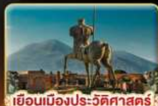
เยือนเมืองประวัติศาสตร์ ปอมเปอี