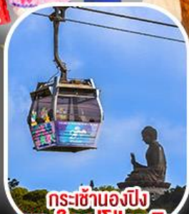
กระเช้าเองปีง พระใหญ่ไผ่หลิน