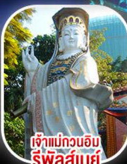
เจ้าแม่กวนอิม รีพีลส์เบย์