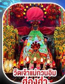
วัดเจ้าแม่กวนอิม ฮ่องฮำ