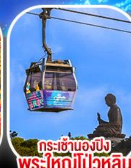
กระเช้าเองปีง พระใหญ่โป่วหลิน