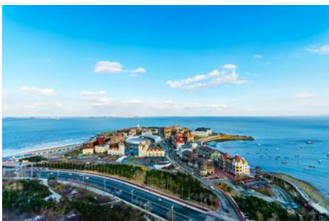
ท่าเรือชาวประมง

08.05 น. ถึงสนามบินเมืองเยียนไถ (เวลาที่ท้องถิ่นเร็วกว่าไทย 1 ชั่วโมง) นำท่านผ่านการตรวจตราเอกสารและรับสัมภาระเรียบร้อย นำท่านเดินทางโดยรถบัสปรับอากาศ เดินทางสู่เมืองเยียนไถ