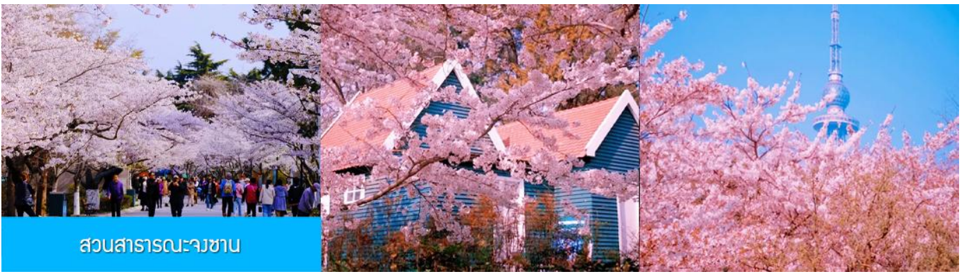
สวนสาธารณะจางชาน

ถึงชิงเต่า นำท่านชมสวนสาธารณะจางชาน สวนจางชานได้ขึ้นชื่อว่าเป็นสวนที่ชมซากุระสวยที่สุดในเมืองชิงเต่า พอถึงช่วงดอกบาน ต้นซากุระสองข้างทางจะผลิบานพร้อมกัน กลายเป็นอุโมงค์สีชมพูขาว เดินเข้าไปในสวน แล้วบรรยากาศคือหวานละมุน และดูโรแมนติก จะบานช่วงปลายมีนา ถึง ต้นพฤษภาคม