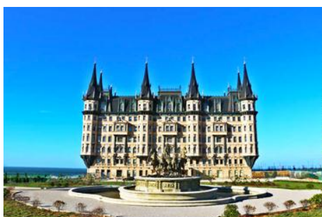
คฤหาสน์เหวินเจิง

นำท่านไปเยือนเมืองท่าสุดโรแมนติคสไตล์ยุโรป ท่าเรือชาวประมง ให้ท่านได้ชมสถาปัตยกรรมสไตล์อเมริกาเหนือ และ ยุโรป ที่ตั้งอยู่ในผืนแผ่นดินจีน ณ เมืองเยียนไถ เก็บบรรยากาศลมทะเล และเก็บรูปกับอาคารหลังคาสีสดใสเป็นฉากหลัง ที่เต็มไปด้วยมนต์เสน่ห์และความทรงจำที่สวยงาม ให้ท่านเก็บภาพความสวย