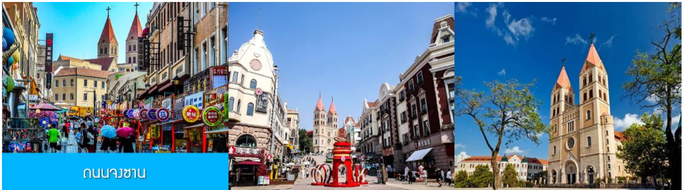
ถนนจงซาน

หลังอาหารนำท่านเดินทางชม สะพานจ้านเจียว เป็นแลนด์มาร์กประวัติศาสตร์คู่เมืองชิงเต่า สร้างเมื่อปี ค.ศ. 1891 มีลักษณะเป็นสะพานหินทอดยาวกว่า 440 เมตรสู่ทะเล ปลายสะพานมีศาลา ทรงแปดเหลี่ยมสีแดงที่โดดเด่น ซึ่งเป็นสัญลักษณ์บนฉลากเบียร์ชิงเต่า ขึ้นชื่อเรื่องวิวสวย รับลมทะเล ให้ท่านเก็บภาพบรรยากาศ จากนั้นนำท่านเดินเที่ยวชม ถนนจงซาน 中山路 ถนนที่เต็มไปด้วยกลิ่นอายยุโรป และถนนสายนี้มีบันทึก เรื่องราวมากกว่าศตวรรษของเมืองชิงเต่าไว้ ที่นี่เป็นศูนย์กลางการค้าแห่งแรกที่เต็มไปด้วยสถาปัตยกรรมสไตล์ ยุโรปเก่าแก่ที่ได้รับอิทธิพลมาจากเยอรมัน ให้ท่านได้เดินเก็บบรรยากาศ และ เก็บภาพกับ โบสถ์เซนต์ไมเคิล (ด้านนอก) โบสถ์แห่งนี้ที่คู่รักนิยมมาถ่ายภาพงานแต่งงานกันมากที่สุดในเมืองชิงเต่า ให้ท่านถ่ายรูปเก็บภาพ จากนั้นเดินทางต่อ สู่ย่าน เมืองเก่าเยอรมัน ตรอกกว้างชิงหลี่ 广兴里 ตรอกชอกชอยที่เรียงรายไปด้วยอาคาร สถาปัตยกรรมแบบ ผสมผสานจีนและอาคารสไตล์ยุโรป