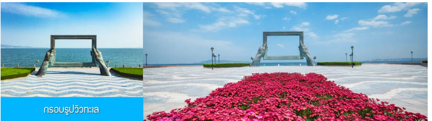
กรอบรูปวิวทะเล

พักที่ Holiday Inn Express Hotel หรือ ระดับมาตรฐาน 4 ดาว ท้องถิ่น