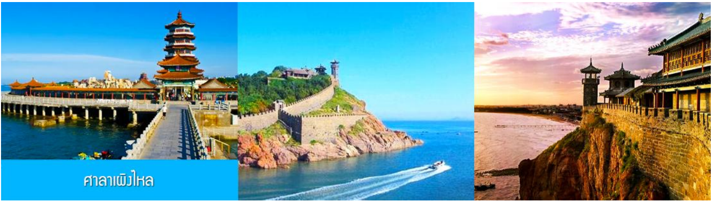
ศาลาเพิงไหหล

หลังอาหารนำท่านเดินทางสู่เมืองเพิงไหหล ชม ศาลาเพิงไหหล ดินแดนแห่งเทพเซียน และเป็นหนึ่งในสี่สถาปัตยกรรมโบราณที่งดงามของจีน ซึ่งตั้งอยู่ริมทะเล ( ชมด้านนอก ) นำท่านชมชุ่มประตู่เพิงไหหล พระราชวังมังกร พระราชวังราชินีแห่งสวรรค์ และศาลาหลัก ชมทัศนียภาพอันตระการตาของเขตแดนทะเลเหลือง-ทะเลป้อไห่ ชม " ศาลาอมตะทะยานสู่ท้องฟ้า " จากนั้นนำท่านเดินทางไปยัง จุดชมวิวแปดเซียนข้ามทะเล ชมสถานที่สำคัญอันเป็นสัญลักษณ์ เช่น หอคอยเซียนหยวน กำแพงแปดเซียน และศาลาขู่เซียน โครงสร้างรูปทรงน้ำเต้าที่ล้อมรอบด้วยทะเลทั้งสามด้าน เชื่อมโยงตำนานแปดเซียนเข้ากับ ความมหัศจรรย์ของภาพลวงตา