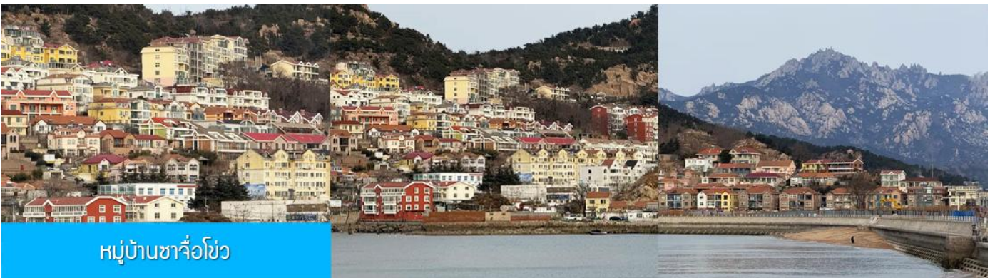
หมู่บ้านซาจื่อโขว่

เที่ยง รับประทานอาหารกลางวัน ณ ภัตตาคาร (มื้อที่ 7)