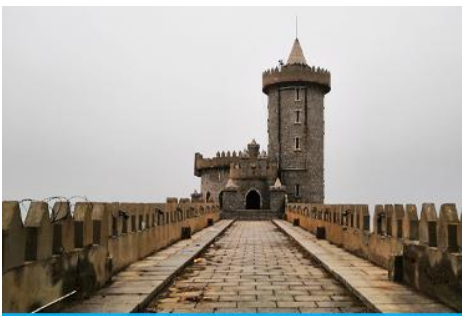
คาเฟ่อีสต