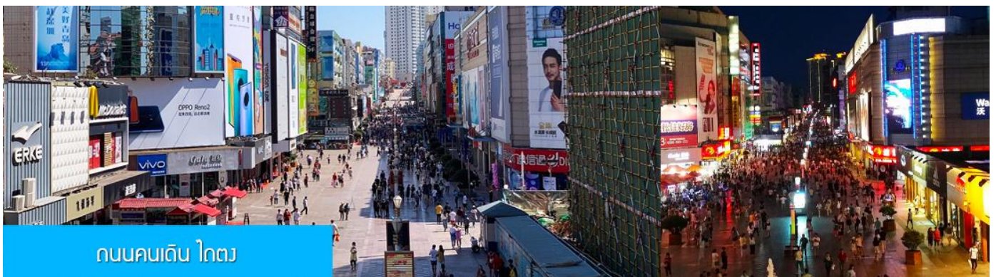
ถนนคนเดิน ไถตง

จากนั้นนำท่านเที่ยวชม โรงเบียร์ชิงเต่า 青岛啤酒博物馆 พิพิธภัณฑ์เบียร์ที่ขึ้นชื่อของเมืองชิงเต่า ซึ่งเป็นเบียร์ยี่ห้อแรกที่ผลิตขึ้นในประเทศจีน ชมเบียร์ คอลเลกชันที่มียี่ห้อหลากหลายที่สุดของโลก และชมการจัดแสดงภาพและวิดิทัศน์เกี่ยวกับวิวัฒนาการของเบียร์ ขั้นตอนการผลิตและอื่น ๆ ที่เกี่ยวข้อง พร้อมชิมเบียร์ชิงเต่า ซึ่งเป็นเบียร์ที่ขายดีที่สุดในยี่ห้อหนึ่งของจีน.. (ชิมเบียร์ชิงเต่าท่านละ 1 แก้ว รับกลับอีก 1 ขวดเล็ก ตอนเดินออก)