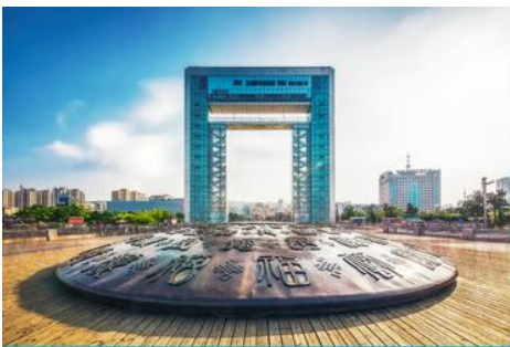
ประตูแห่งโชค