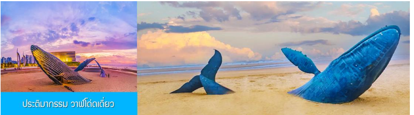
ประติมากรรม วาฟโดดเดี่ยว

หลังอาหารนำท่านเดินทางสู่เมืองเพิงไหหล ชม ศาลาเพิงไหหล ดินแดนแห่งเทพเซียน และเป็นหนึ่งในสี่สถาปัตยกรรมโบราณที่งดงามของจีน ซึ่งตั้งอยู่ริมทะเล ( ชมด้านนอก ) นำท่านชมชุ่มประตู่เพิงไหหล พระราชวังมังกร พระราชวังราชินีแห่งสวรรค์ และศาลาหลัก ชมทัศนียภาพอันตระการตาของเขตแดนทะเลเหลือง-ทะเลป้อไห่ ชม " ศาลาอมตะทะยานสู่ท้องฟ้า " จากนั้นนำท่านเดินทางไปยัง จุดชมวิวแปดเซียนข้ามทะเล ชมสถานที่สำคัญอันเป็นสัญลักษณ์ เช่น หอคอยเซียนหยวน กำแพงแปดเซียน และศาลาขู่เซียน โครงสร้างรูปทรงน้ำเต้าที่ล้อมรอบด้วยทะเลทั้งสามด้าน เชื่อมโยงตำนานแปดเซียนเข้ากับ ความมหัศจรรย์ของภาพลวงตา