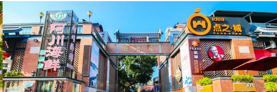
หมู่บ้านชาวประมง เจิงจ้าวอัน