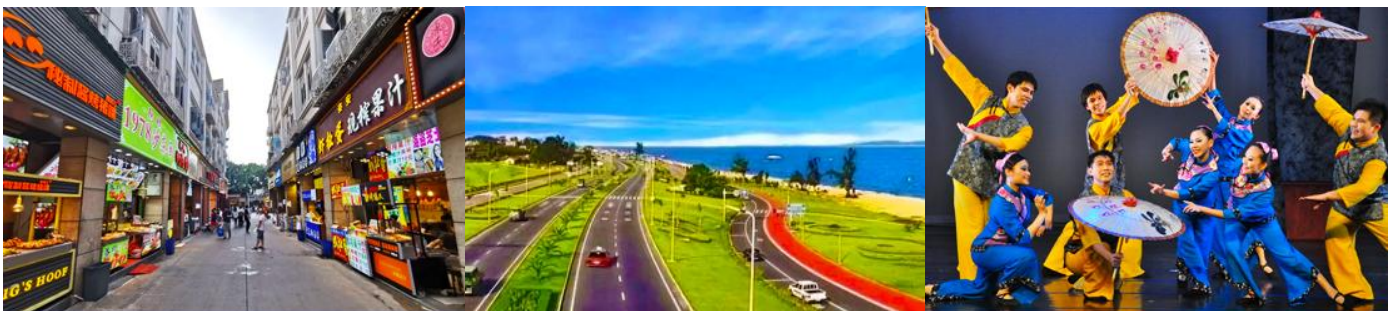
ถนนวซาลู่

พักที่ โรงแรม XIAMEN HENGLONG HOTEL 4* หรือเทียบเท่าในเมืองเซี่ยเหมิน