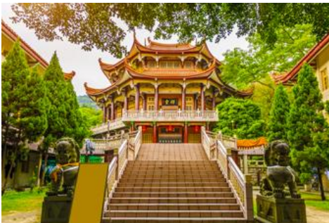
วัดหนานถ้าวชื่อ

ค่ำ รับประทานอาหารค่ำ ณ ภัตตาคาร (1) พักที่ โรงแรม XIAMEN HENGLONG HOTEL 4* หรือเทียบเท่าในเมืองเซี่ยเหมิน