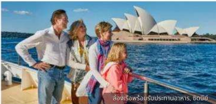
ล่องเรือพร้อมรับประทานอาหาร, ซิดนีย์