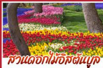
สวนดอกไม้อักษ์ตันบูค