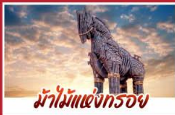
ม้าไม้แห่งกรอย