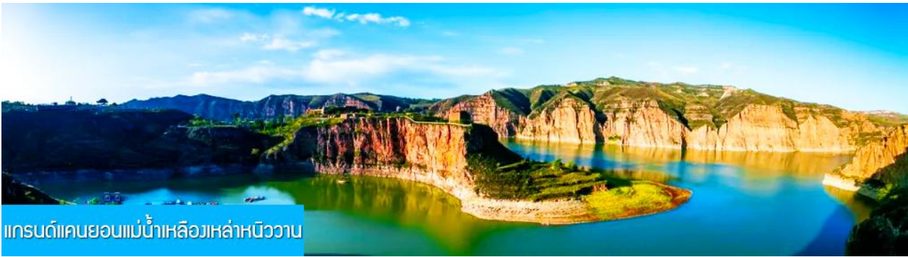
แกรนด์แคนยอนแม่น้ำเหลืองเหล่าหนิววาน

พักที่ DALATEQI SHNAGJING HOTEL โรงแรมระดับ 4 ดาวหรือเทียบเท่าในเมืองต้าลาเท่อ