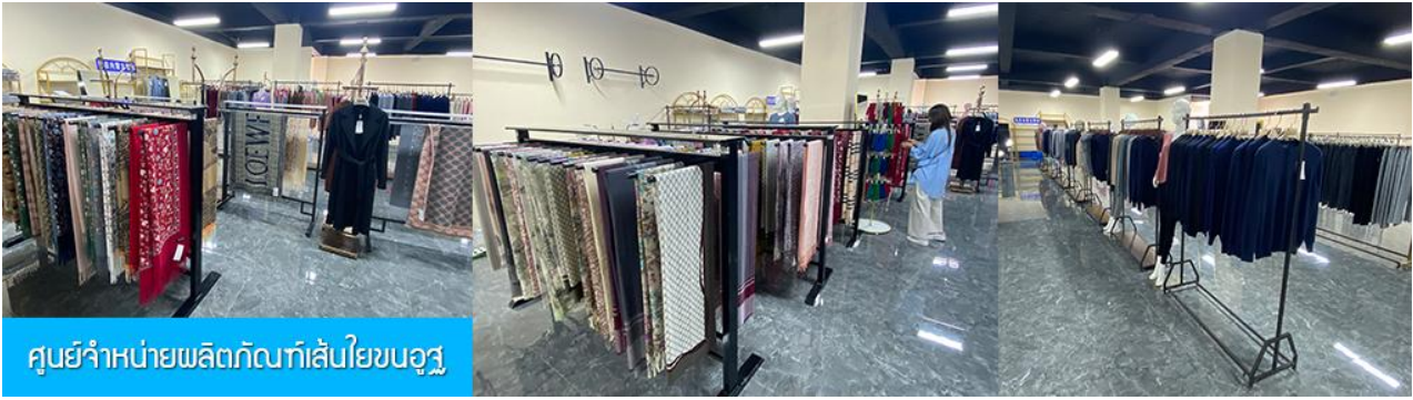
ศูนย์จำหน่ายผลิตภัณฑ์เส้นใยขนอูฐ