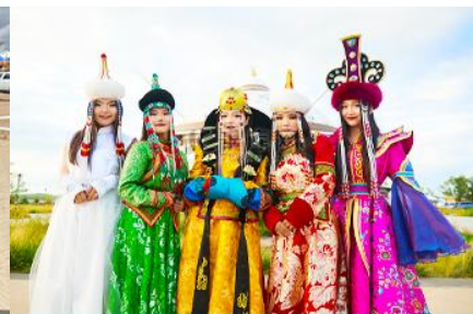
แต่งชุดพื้นเมืองบอโกล