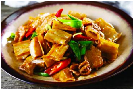
ถนนคนเดินเออร์ดอส

จากนั้นนำท่านเที่ยวชม อุทยานคังปาสือ 康巴什景区 เป็นเขตเมืองใหม่ที่ถูกเนรมิตรขึ้นและได้รับการขึ้นทะเบียนเป็นอุทยานท่องเที่ยวระดับ 4A และเป็นศูนย์กลางความเจริญของเมืองเออร์ดอส ประกอบด้วยจัตุรัส ธีม ปาร์ค พิพิธภัณฑ์ แกรนด์เธียร์เตอร์ ศูนย์วัฒนธรรม และสนามแข่งรถนานาชาติ นำท่านนั่งรถผ่านชมจัตุรัส รัฐบาล ทะเลสาบอุหลันมู่ สวนศิลปะงานปติมากรรมเอเชีย ฯลฯ