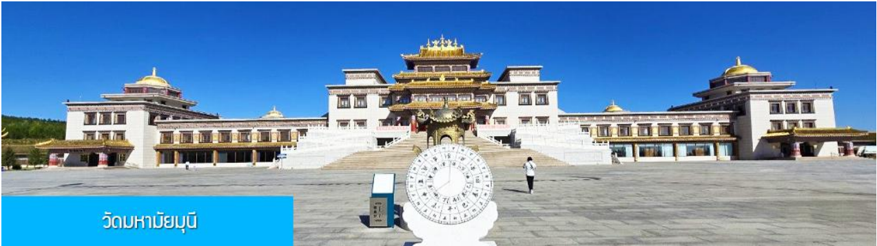
วัดมหาชัยมุนี