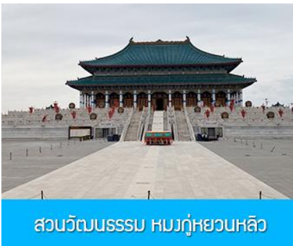
สวนวัฒนธรรมหมงกู่หยวนหลิว

พักที่ ORDOS BOYU AIRUI HOTEL โรงแรมระดับ 4 ดาวท้องถิ่น หรือเทียบเท่าในเมืองเออร์ดอส