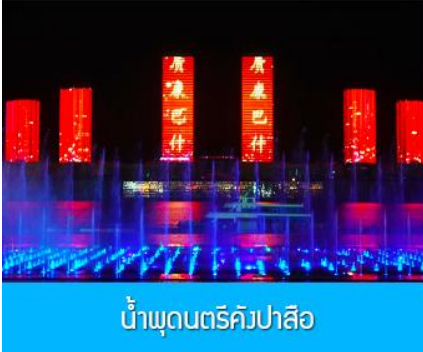
น้ำพุดนตรีคังปาสือ

จากนั้นนำท่านเดินทางกลับสู่ เมืองเออร์ดอส 鄂尔多斯 (ระยะทาง 180 กิโลเมตรใช้เวลาประมาณ 3 ชั่วโมง ) รับประทานอาหารค่ำ ณ ภัตตาคาร (9)