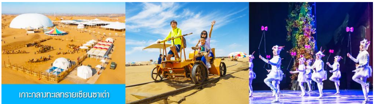
เกาะกลางทะเลทรายเขียนซาเต๋า