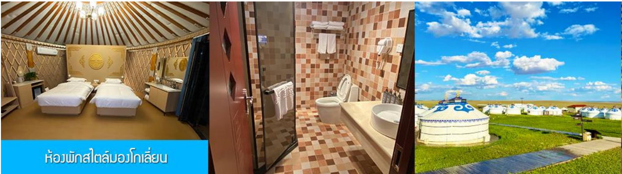
ห้องพักสไตล์มองโกลเลียน