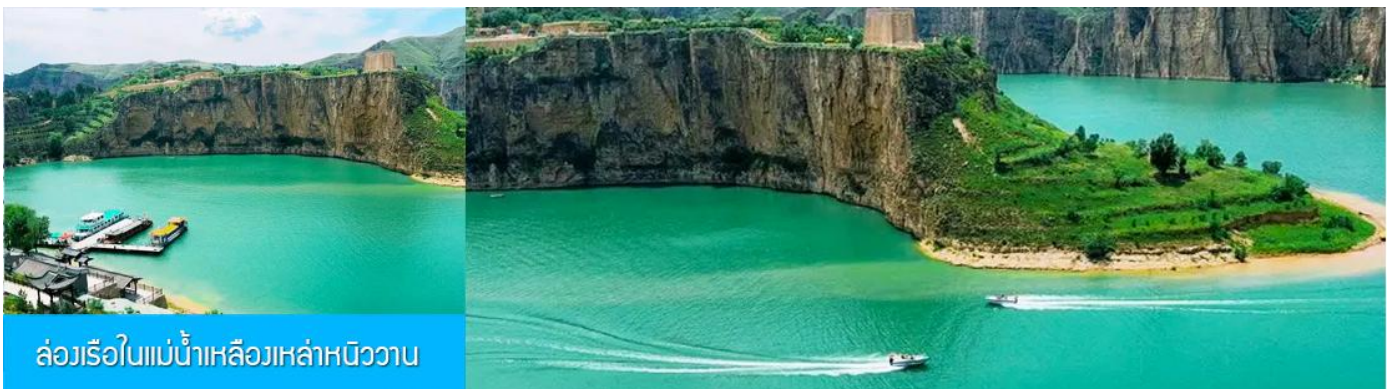
ล่องเรือในแม่น้ำเหลืองเหล่าหนิววาน

เที่ยง รับประทานอาหารกลางวัน ณ ร้านอาหารระหว่างทาง (8)