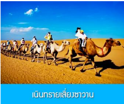
เนินทรายเลี้ยงชาวาน

เที่ยง รับประทานอาหารกลางวัน ณ ภัตตาคาร (5)