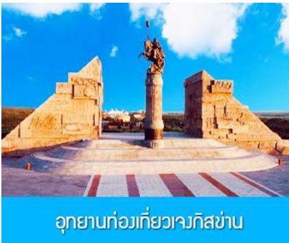
อุทยานทองเทียวเจงกิสข่าน

รับประทานอาหารกลางวัน ณ ร้านอาหารพื้นเมืองในเขตอุทยาน (11)