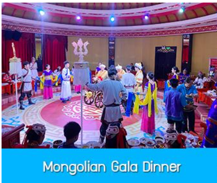
Mongolian Gala Dinner

那达慕 Naadam Festival หรือเทศกาลเฉลิมฉลองที่คล้ายวันตรุษจีนของชาวจีน ประกอบด้วยกิจกรรมการเล่นพื้นเมืองแบบมองโกล รวม 22 อย่าง ได้แก่ พิธีแต่งงานเออร์คอส / การขี่ม้าในสนาม / ปาร์ตี้รอบกองไฟ / ขี่ม้าถ่ายรูป / ไล่ไลเดอร์หญ้า / รถลางทุ่งหญ้า / สวนแขวงกต / สวนเด็กเล่น / ตีกอล์ฟทุ่งหญ้า / รถบังคับ / รถโกคาร์ต / โยนบอลทุ่งหญ้า / ปั่นไฟมองโกล / ยิงธนูในร่ม / แข่งขันจับแกะ / คล้องม้าจำลอง / หมูเลี้ยงน้ำเอ็นดู / เครื่องเล่นหมุน / เลี้ยงแกะโยน / ยิงธนู / ทอยแจกัน / เซ็นต์ชื่อภาษา มองโกล ให้เลือกเล่นได้ 12 อย่างตามรายการที่ระบุ.....อัตราค่าบริการสำหรับ 那达慕 Naadam Festival 380 หยวน หรือ 1,900 บาท/ท่าน (สำหรับลูกค้าทัวร์ที่ไม่ซื้อโปรแกรมเสริม สามารถเดินเล่น ถ่ายรูปบริเวณทุ่งหญ้าหรือพักผ่อนตามอัธยาศัย)