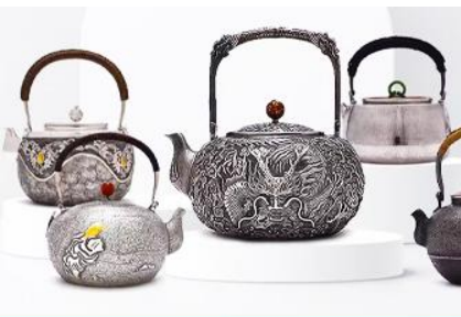
พิพิธภัณฑที่เครื่องปั้นบอโกล