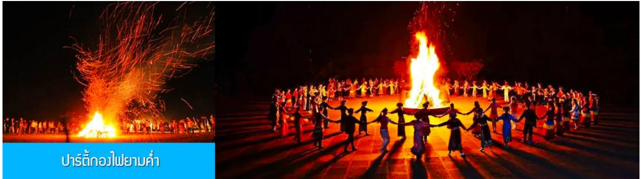
ปาร์ตี้กองไฟยามค่ำ