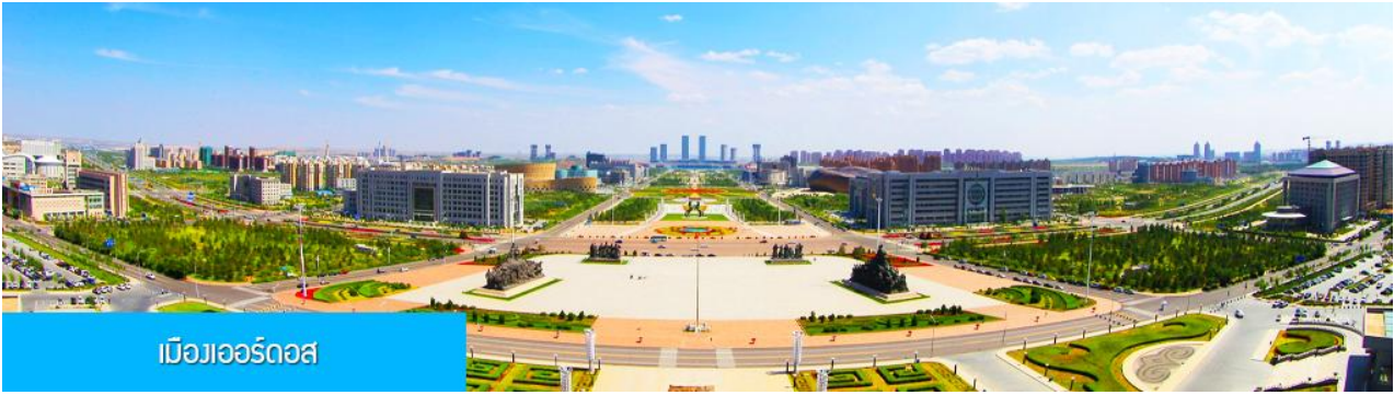
เมืองออร์ดอส