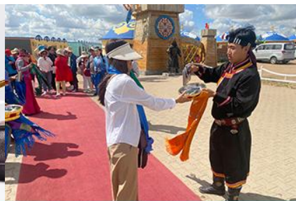
พิธีต้อนรับแขกด้วยเหล้า