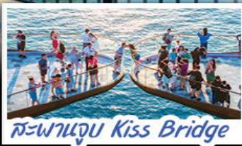
สะพานจูบ Kiss Bridge