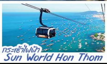
กระเช้าไฟฟ้า Sun World Hon Thom