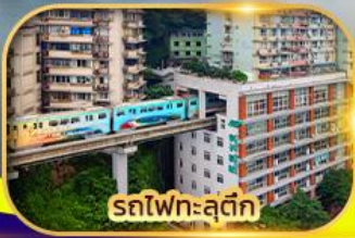
รถไฟทะลุตึก