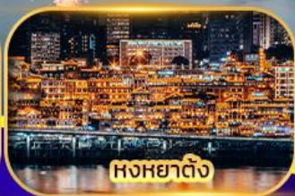
หงหยาดิง