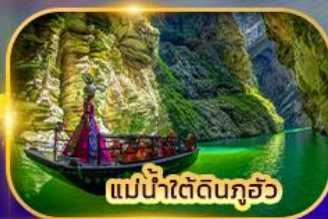
แม่น้ำใต้ดินกุ้ยโจว