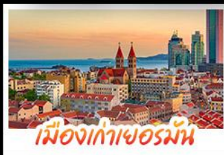
เมืองเก่าเยอรมัน

เมืองเก่าชิงเต่า - สลับกับเมืองโบราณหมิงสุ่ย เมืองเก่าเยอรมัน - ไรไวน์ฟางยู - สวนสตรอว์เบอร์รี่