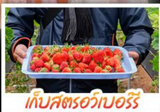
เก็บสตรอว์เบอร์รี่