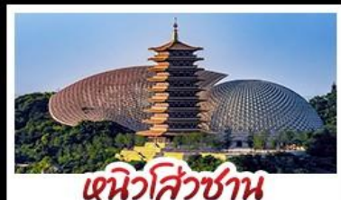
ฉนวนสีวี่ชาน