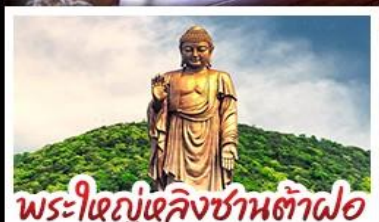
พระใหญ่เล็งซันต้าฝอ