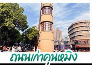
ถนนเก้าคุนหมิง