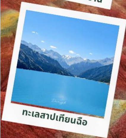
ทะเลสาปเทียนฉือ