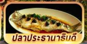
ปลาประรานาธิบดี