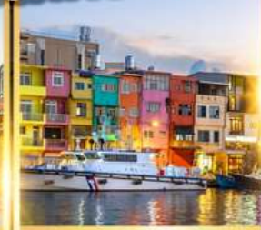
ท่าเรือประมงเจิ้งปิง