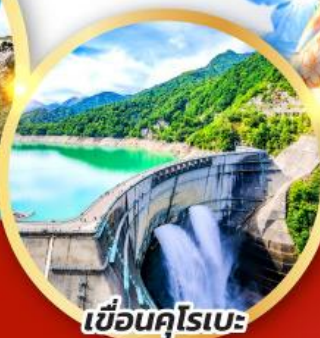
เขื่อนคุโรเบะ