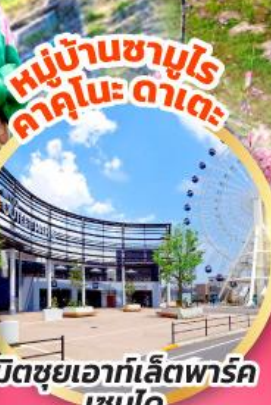
มิตซูเอากะไลท์พาร์ค เซนได