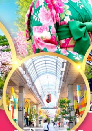
ช้อปปิ้ง ถนนอิชิบังโจ