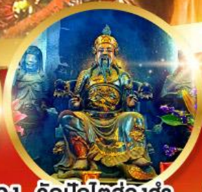
วัดปักไต้ฮ้องฮำ