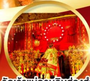
วัดเจ้าแม่กวนอิมฮ้องฮำ