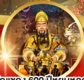
วัดแซก 600 ปีหยุดหลง