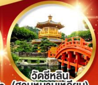
วัดซีหลิน (สวนหนานเท่หลิน)