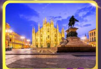
มหาวิหารคูโอโม