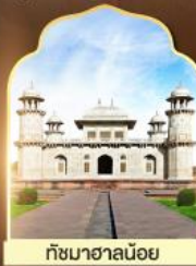
ทัชมาฮาลน้อย