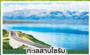
ทะเลสาบไซรัม