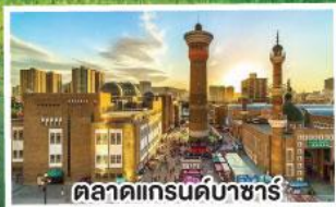
ตลาดแกรนด์บาซาร์