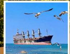
เรือสินค้าเกย์ตันบลูอิส