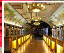
พิพิธภัณฑ์ไวน์ชิงเต่า