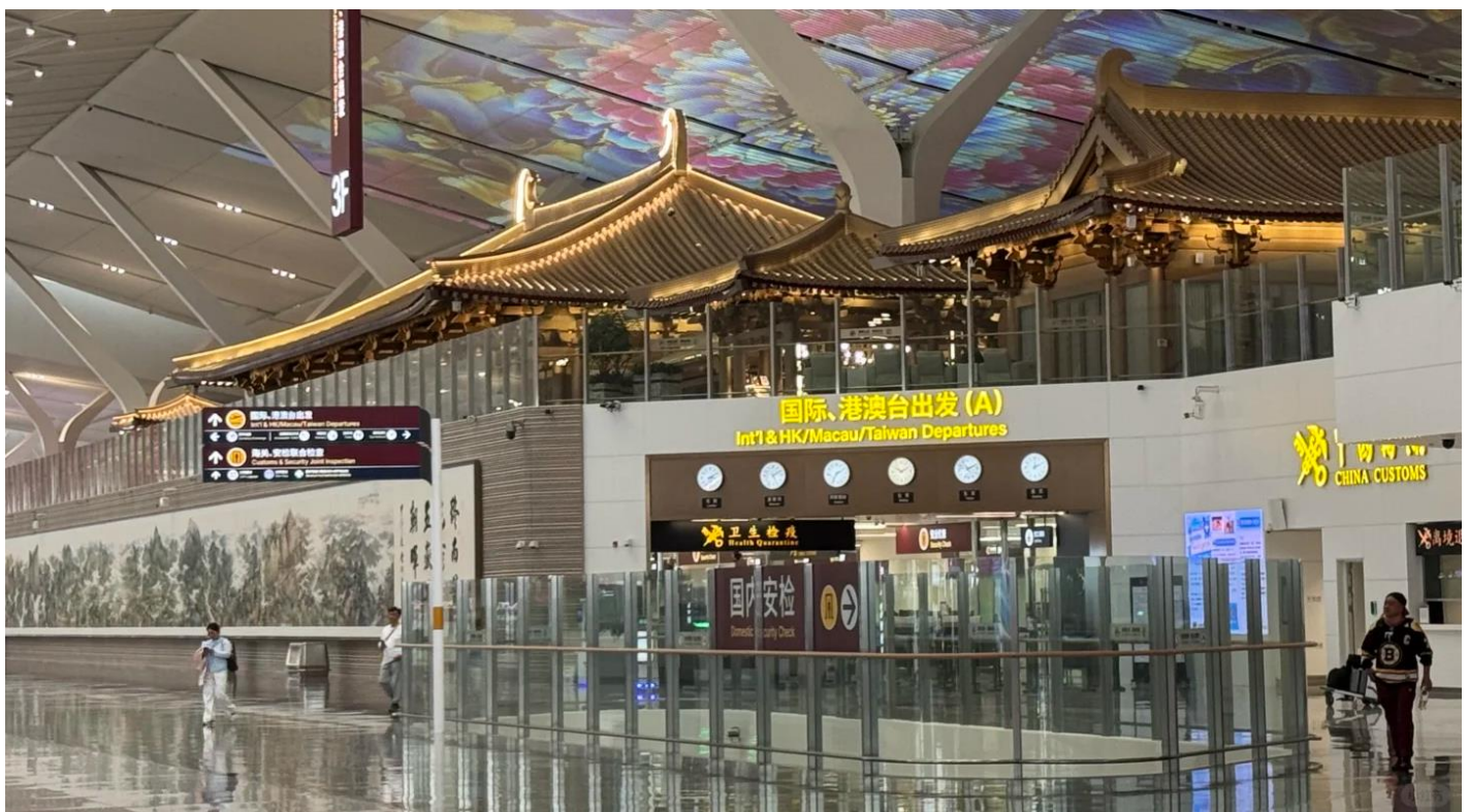
GO1XIY-SL006 บินตรงซีอาน ย้อนเวลาสู่อางอัน เจิ้งโจว ลั่วหยาง หยุนไถซาน 6 วัน 5 คืน โดยสายการบิน ไทย ไลออนแอร์ (SL)