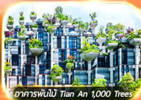
อาคารพันไม้ Tian An 1,000 Trees