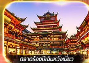
ตลาดร้อยปีเงินหวงเหมียว

เที่ยวดิสนีย์แลนด์เต็มวัน (รวมบัตร + รถรับส่ง) ช้อปปิ้งย่านดัง นานกิง, เงินหวงเหมียว