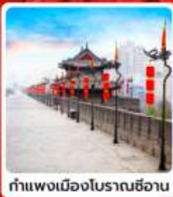
กำแพงเมืองโบราณซีอาน