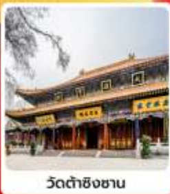
วัดต้าชิงซาน