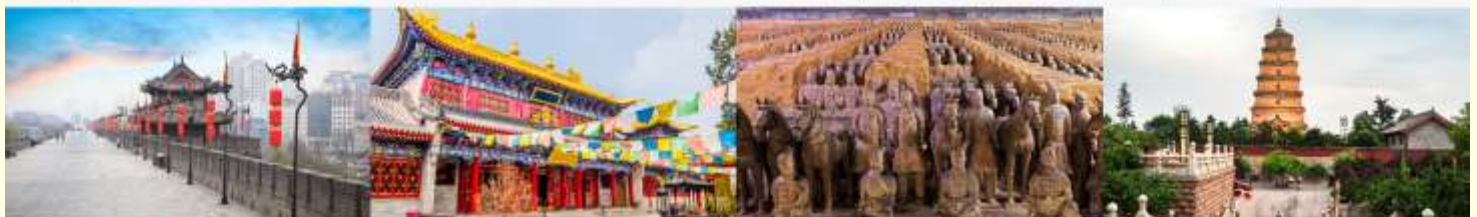
กำแพงเมืองโบราณ