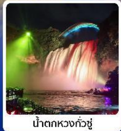
น้ำตกหวงกั๋วซู่