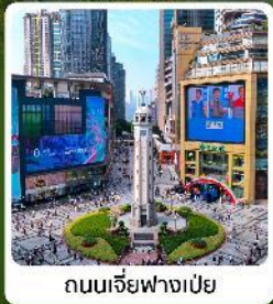
ถนนเจียฟางเป่ย์