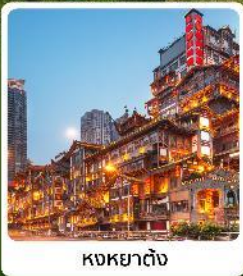
หงหยาดิง